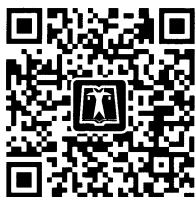
中国电力出版社官方微信