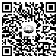
电力标准信息微信