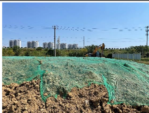
施工期对柚山变裸露场地进行覆盖照片