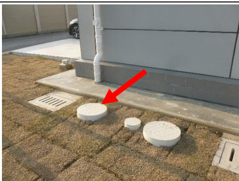
图6-3 110kV 柚山变化粪池照片