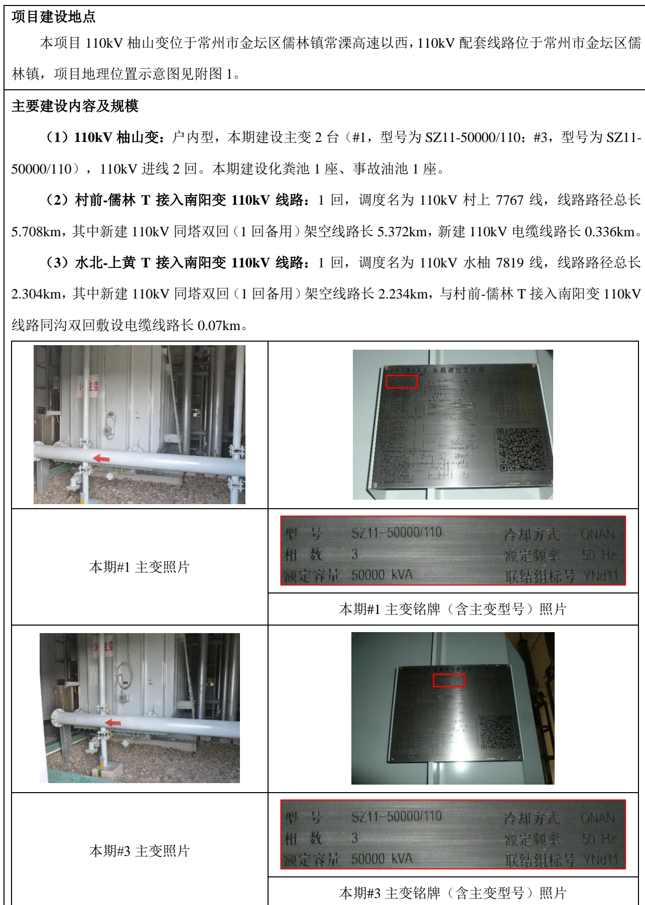
表 4 建设项目概况