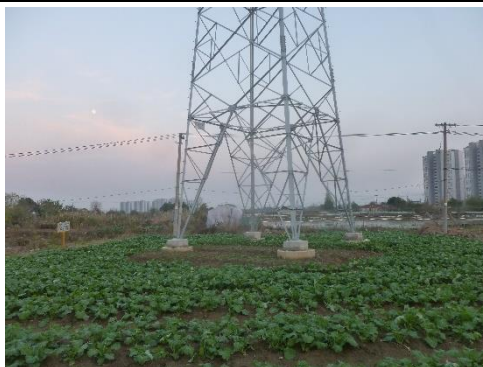
110kV 架空线路塔基周围生态恢复照片