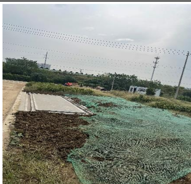
施工期堆料区设置覆盖照片