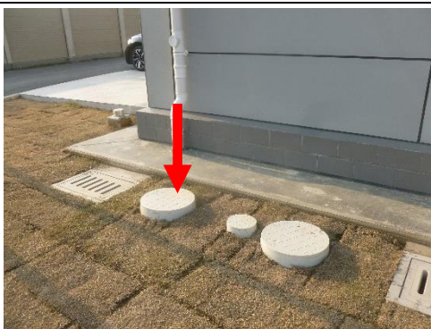
图 8-2 110kV 柚山变化粪池照片

本项目 110kV 柚山变属于无人值守变电站，变电站建有化粪池，产生少量的生活污水经化粪池处理后由环卫部门定期清理，不外排。