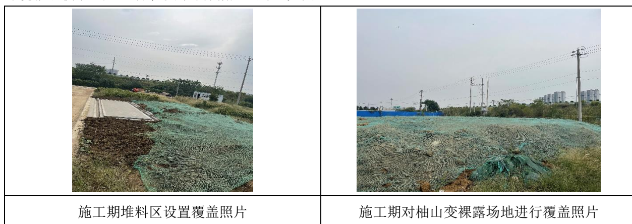
图 8-1 施工期采取的环保措施照片

施工期固体废物主要为施工人员的生活垃圾和建筑垃圾两类。施工过程中进行了及时清理，对周围环境影响较小。施工期采取的环保措施照片，见图 8-1。