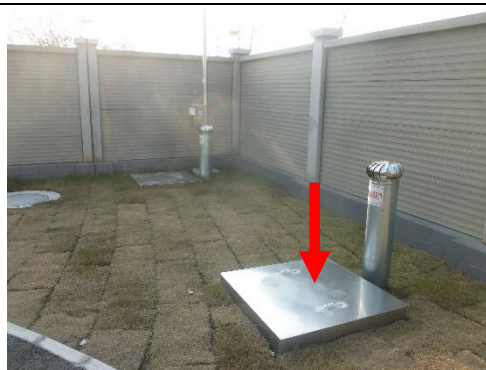
图6-4 110kV 柚山变事故油池照片