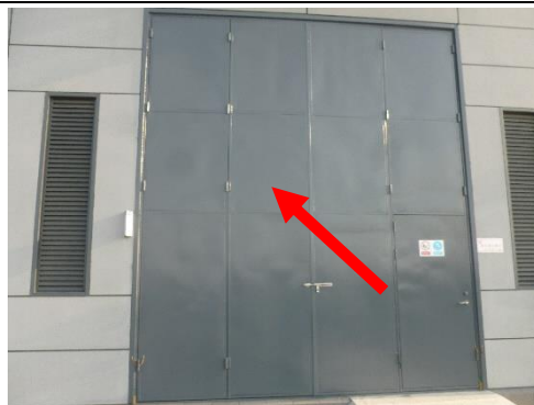
图6-2 110kV 柚山变主变室外隔声门照片