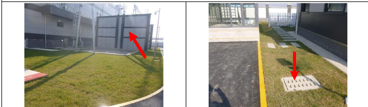
图6-2 220kV汇贤变预留主变间防火防爆墙照片