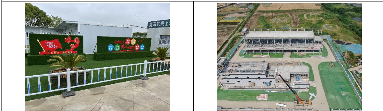
施工期施工营地照片