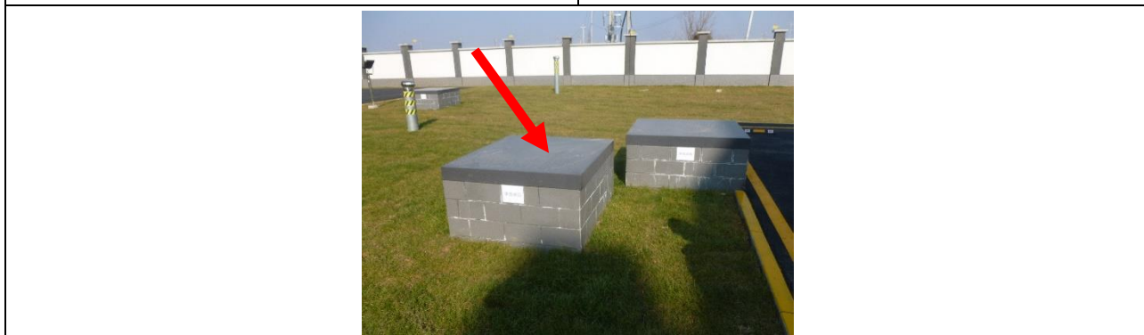
图6-4 220kV汇贤变事故油池照片