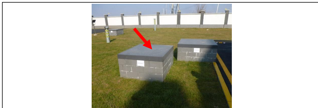
220kV 汇贤变事故油池照片

本项目 220kV 汇贤变设有事故油池，本期为开关站，无变压器，故变压器无漏油产生。220kV 汇贤变事故油池照片见图 8-4。