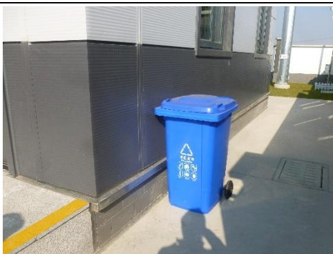
图 8-3 220kV 汇贤变站内生活垃圾分类收集箱

本项目 220kV 汇贤变的日常巡视、检修等工作人员产生的少量生活垃圾分类收集并由环卫部门定期清理，不外排。本期为开关站，未产生废矿物油 HW08(900-220-08)和废旧铅蓄电池 HW31（900-052-31）危险废物。