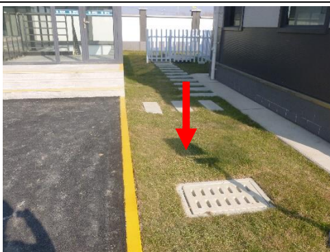
图 8-2 220kV 汇贤变化粪池照片

本项目 220kV 汇贤变属于无人值守变电站，变电站建有化粪池，产生少量的生活污水经化粪池处理后由环卫部门定期清理，不外排。