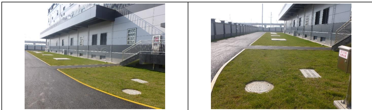
图6-1 本期220kV汇贤变站内绿化照片