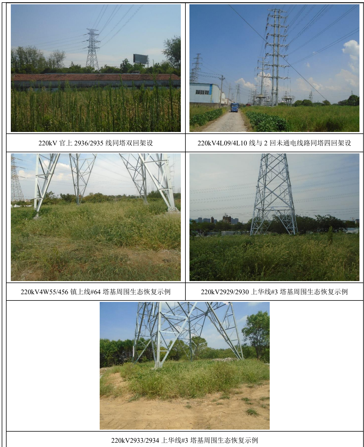
图 8-2 本工程生态恢复示例照片