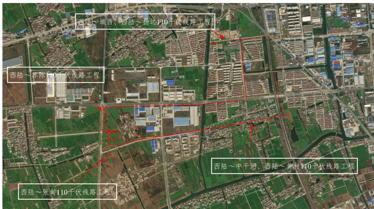
图 2-1 项目总体布置图

泰州西陆 220 千伏变电站 110 千伏送出工程属于新建建设类项目，位于泰州市姜堰区三水街道境内。本项目总体布置示意图如图 2-1。