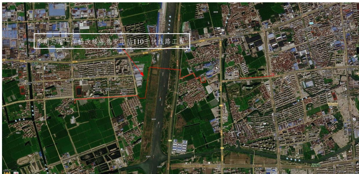
图 2-1 项目总体布置图

泰州九龙~洋桥改接寺巷变电站 110 千伏线路工程属新建建设类项目，位于泰州市海陵区城西街道、九龙镇境内。本项目总体布置示意图如图 2-1。