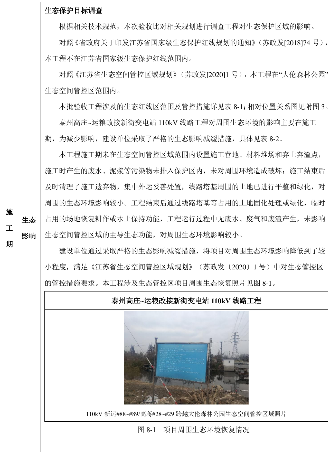
图 8-1 项目周围生态环境恢复情况