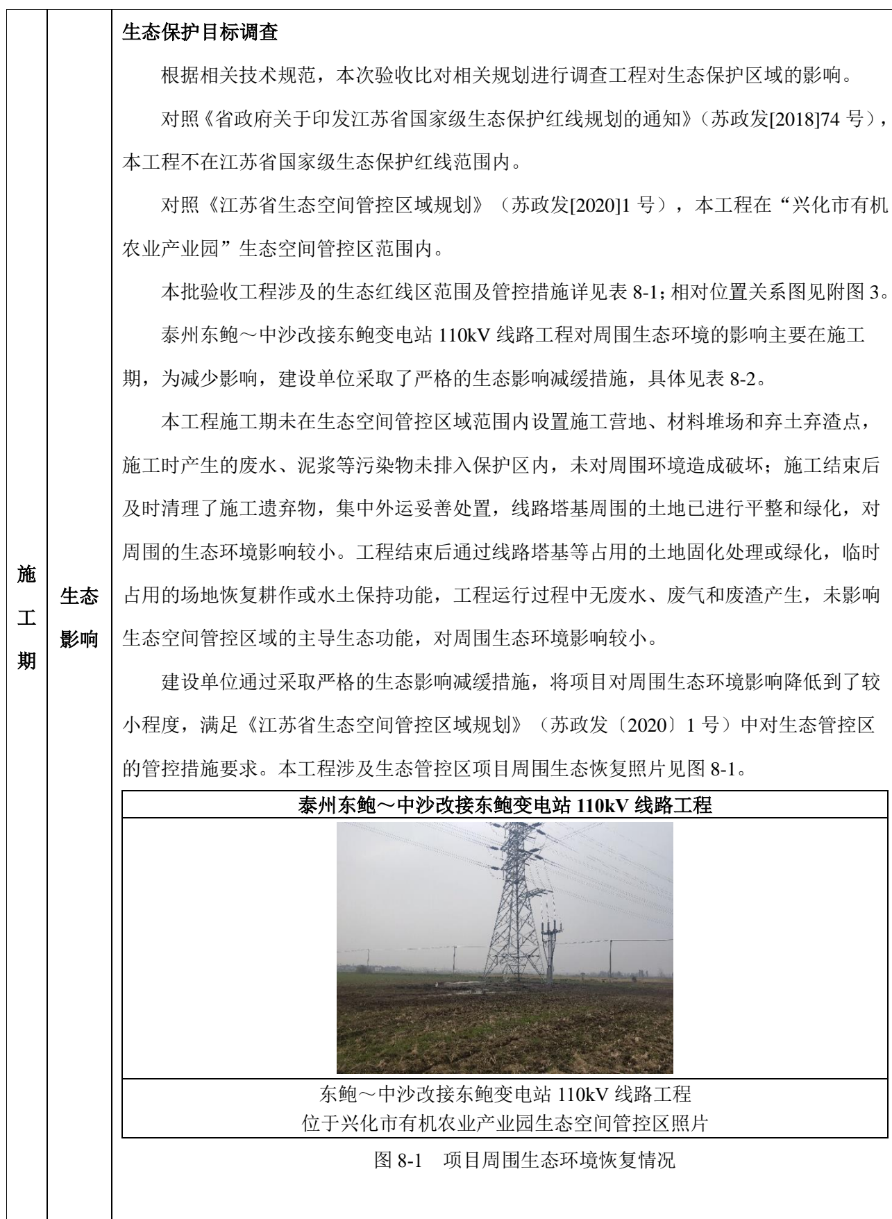
表 8 环境影响调查