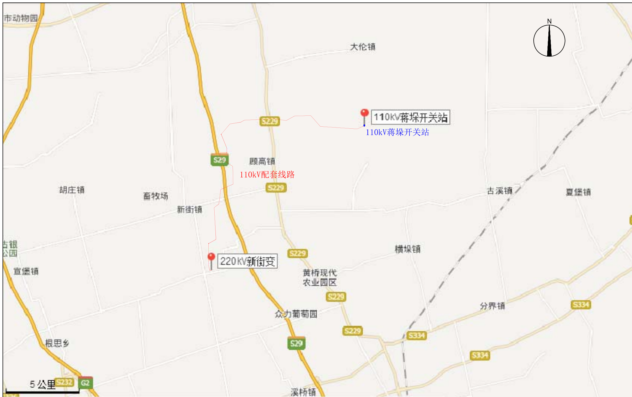
附图1 建设项目地理位置图